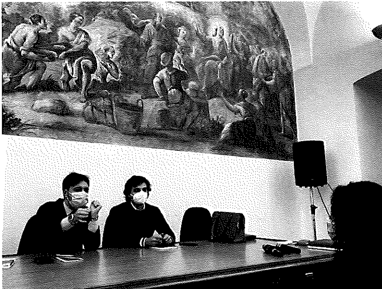
in foto simulazione di un colloquio di lavoro

A seguire un ricco percorso didattico articolato in quattro momenti, che prevede l'utilizzo delle più moderne tecnologie per le costruzioni. Saranno infatti illustrate la "Vr e gamification per la formazione degli operatori in sicurezza"; seguirà una simulazione virtuale delle attività di montaggio e smontaggio di un ponteggio e sarà presentato il caschetto "salvavita", un casco intelligente ed ecosostenibile che comunica in tempo reale se e quando gli operai lo indossano in modo corretto. Infine, saranno illustrati gli strumenti di valutazione del rischio a cui possono essere esposti i lavoratori: rumore, gas, microclima, vibrazioni meccaniche, radon e polveri.