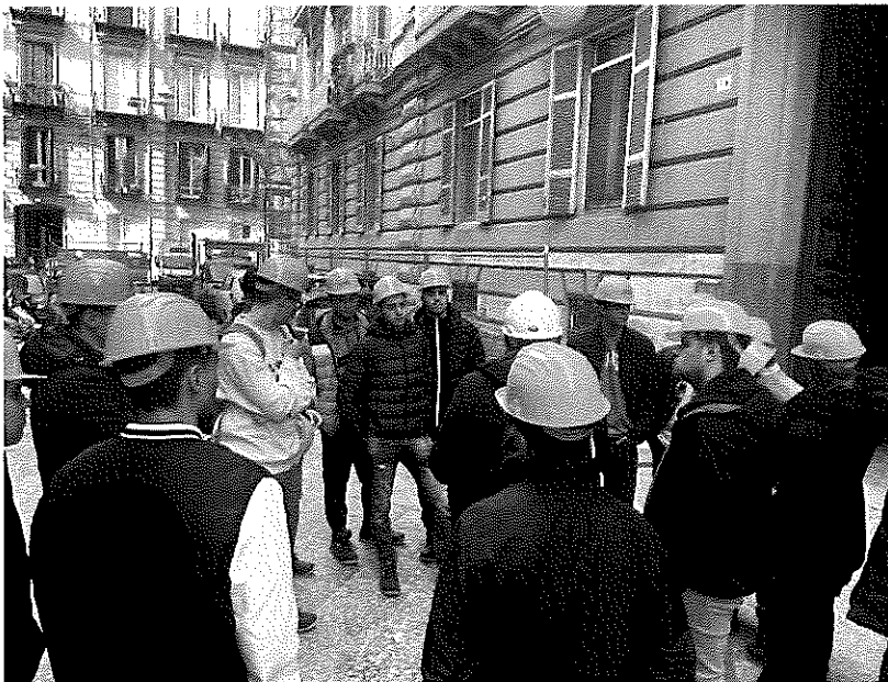
in foto visita in un cantiere

Si chiude domani, venerdì 28 aprile, alle ore 9 , presso il Cfs – Centro Formazione e Sicurezza di Napoli (via Leonardo Bianchi, 36 – Napoli) la tredicesima edizione del progetto di orientamento al lavoro "...E Adesso?" . Il percorso, che ha già formato più di mille studenti, è organizzato da Acen, Inail Campania e Ispettorato Interregionale del Lavoro Sud, in collaborazione con il Cfs Napoli e il Collegio dei Geometri e Geometri Laureati di Napoli, ha l'obiettivo di orientare le figure professionali dell'edilizia di domani, in sinergia con le principali istituzioni del territorio.